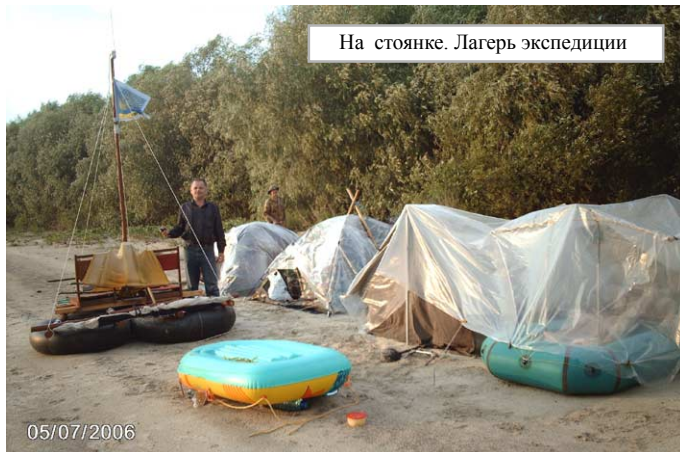
На стоянке. Лагерь экспедиции

После ужина слышим громкие разговоры на реке. Из-за деревьев нас кто-то зовет: “Мужики, увидите нас, офигеете!” С интересом ждем появления обещанного. И действительно, выплыл плот, погруженный в воду. Торчит