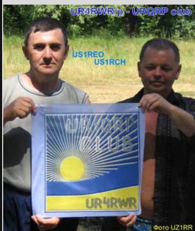
Флаг плота UR4RWR/p URQRP club