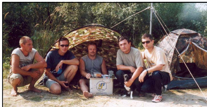
UR5RJU, US5RCW, US1RCH, US1REO, UR5RDX